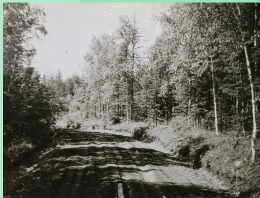
Дорога на Власьево