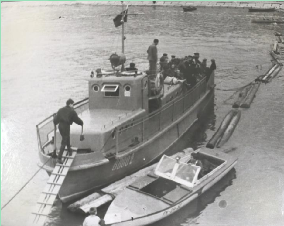
Посадка на катер ВВ002