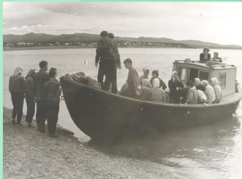
Переправа через Амур