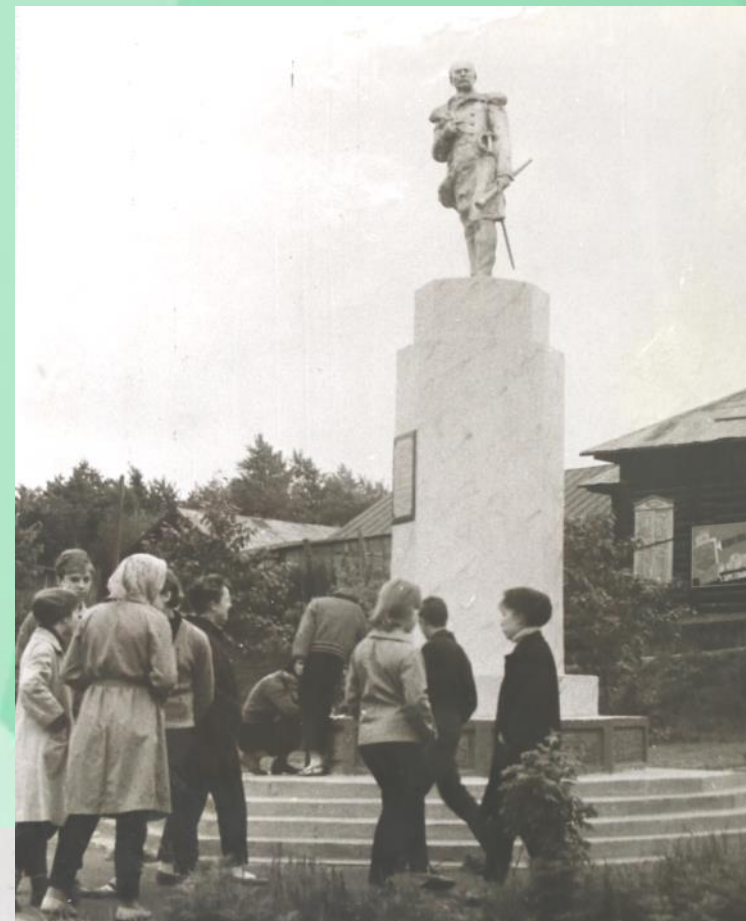
Памятник Невельскому в г. Николаевске