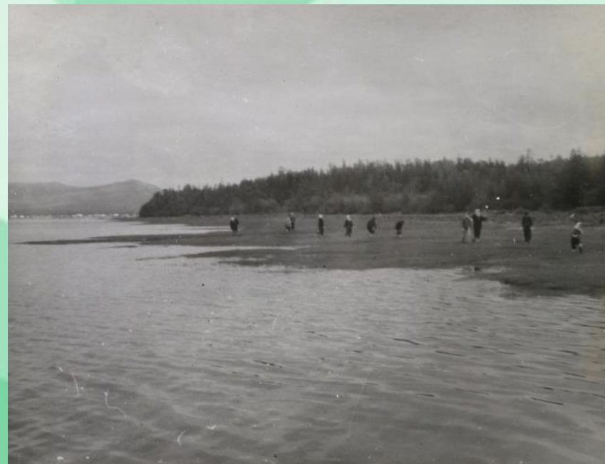
На берегу залива Счастья на мысе Орлова