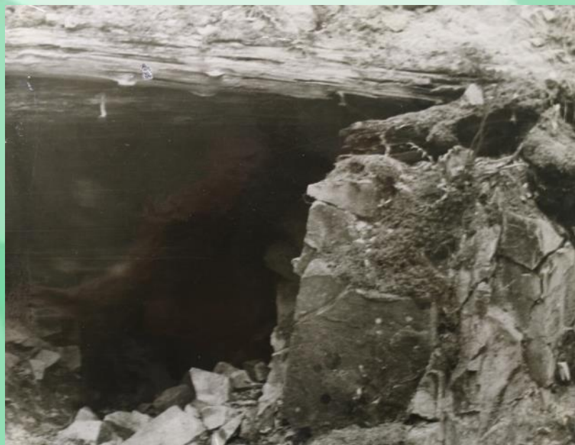
Катакомбы в Чныррах