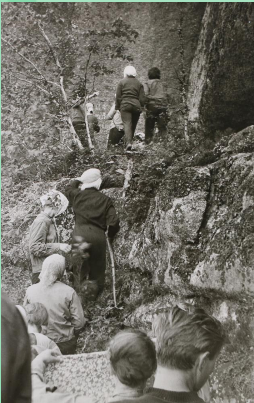
Переход к Шаман-горе