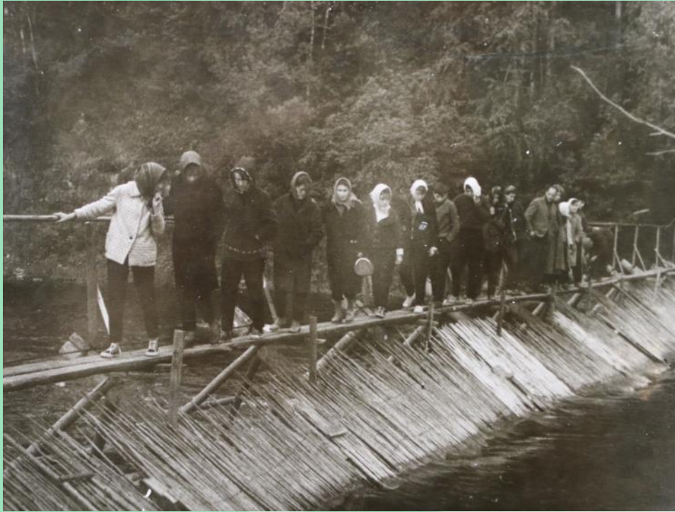
Заездок на реке Иске