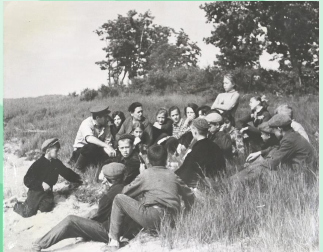
Беседа егеря с участниками похода