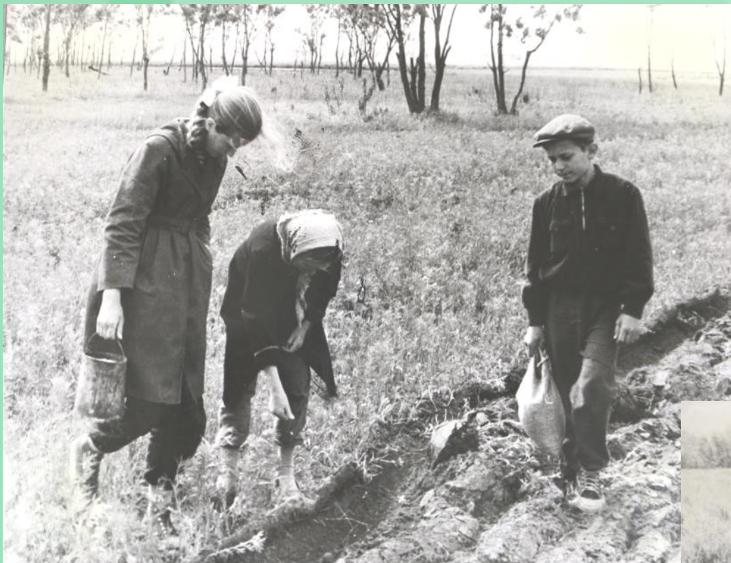
Туристы сеют сою для подкормки зверей и птиц