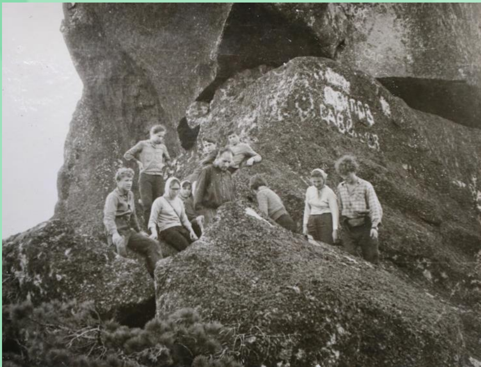
На вершине горы Шаман