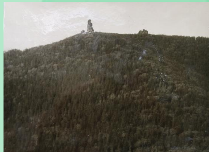
Вид на Шаман-гору