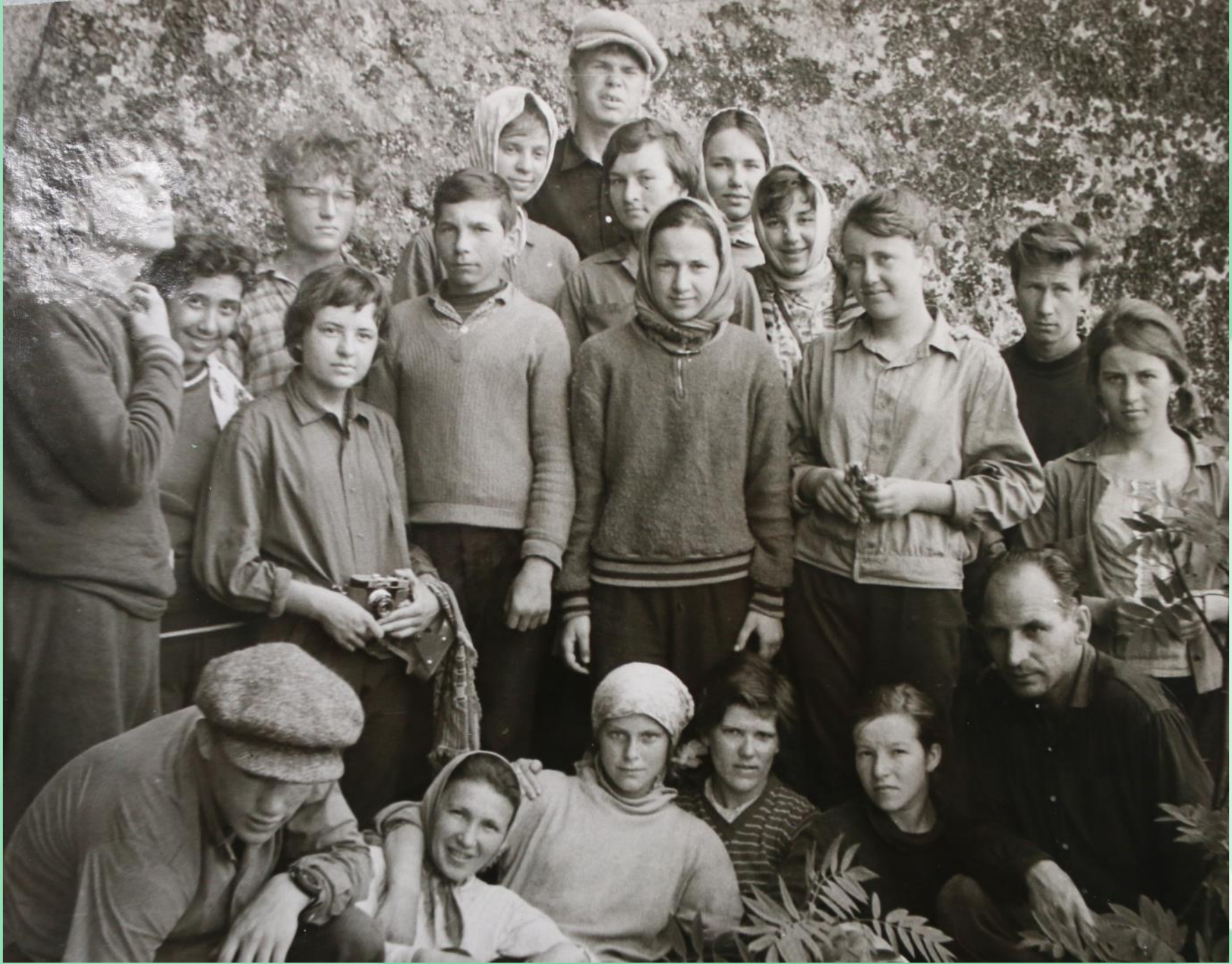
На горе Шаман